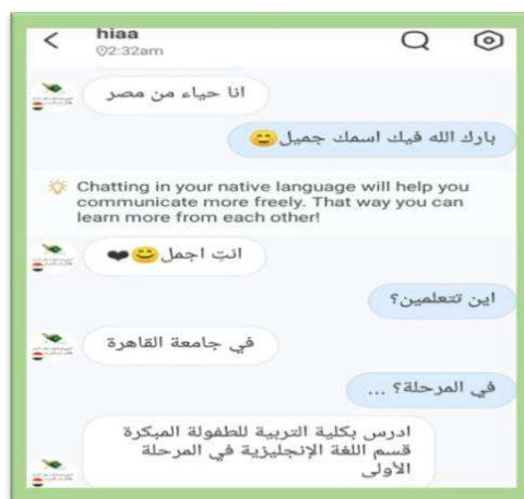
Figure 3. Student Language

Based on Figure 2, it is known that students can determine chat with a native speaker. One of the informants of this interaction is a native speaker from Egypt. Through this interaction, students can develop their abilities. They can express sentences to native speakers; this aims to train the correct sentence patterns according to the rules of the Arabic language being studied. So, students can learn and apply simple sentences with productive abilities. On that basis, the learning process using HelloTalk can be an alternative in the limited time for producing foreign languages in the classroom. Sixth , teachers can provide feedback after students provide assignments through chat activity reports with native speakers on the HelloTalk account. If there are mistakes in producing sentences, the teacher can discuss them with students. In addition, if there is language acquisition through new sentences, the teacher can identify it in class as one of the acquisitions of language in the form of a more complex sentence. It can be illustrated through the conversation in the following figure.