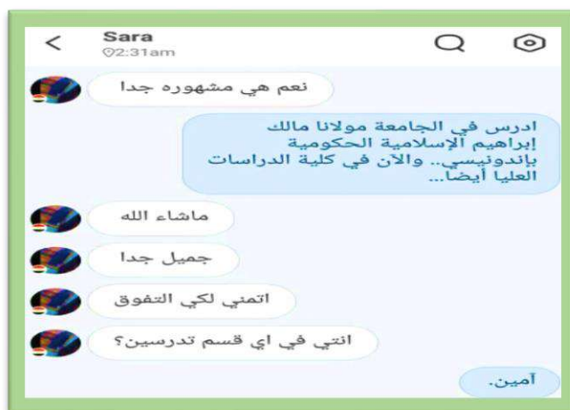
Figure 2. Student Interaction in HelloTalk Media

Based on Figure 2, it is known that students can determine chat with a native speaker. One of the informants of this interaction is a native speaker from Egypt. Through this interaction, students can develop their abilities. They can express sentences to native speakers; this aims to train the correct sentence patterns according to the rules of the Arabic language being studied. So, students can learn and apply simple sentences with productive abilities. On that basis, the learning process using HelloTalk can be an alternative in the limited time for producing foreign languages in the classroom. Sixth , teachers can provide feedback after students provide assignments through chat activity reports with native speakers on the HelloTalk account. If there are mistakes in producing sentences, the teacher can discuss them with students. In addition, if there is language acquisition through new sentences, the teacher can identify it in class as one of the acquisitions of language in the form of a more complex sentence. It can be illustrated through the conversation in the following figure.