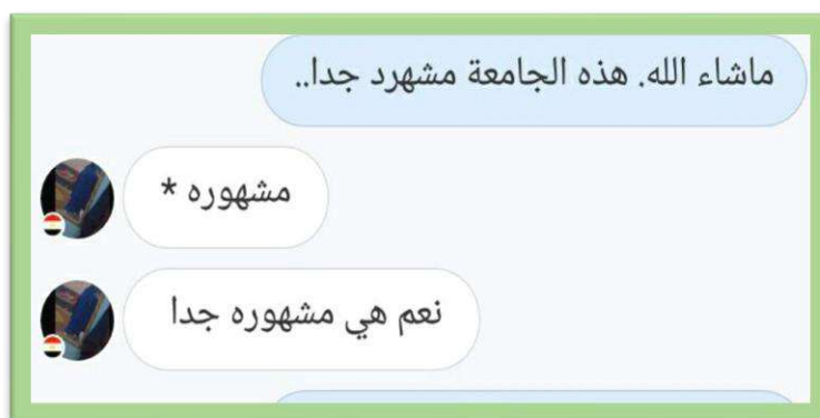
Figure 4. Peer Review Process

The HelloTalk application can provide opportunities for students to think critically and creatively. Some of the impacts obtained by students are that the independent learning process using HelloTalk provides opportunities to communicate in writing, as online-based learning provides opportunities for students to find independent learning resources. Through the statement for native speakers, students can discover their mistakes following the context. Starting from mastering vocabulary, correct writing context, and making simple sentences to ask or answer questions. This process can be a practical learning resource as with the role of native speakers in responding and providing a concrete picture of the correct use of foreign languages. In addition, students' language acquisition is also obtained from non-formal language. As a term that is correct following the meaning and context, it can also be corrected by native speakers. It can be shown in the following figure.