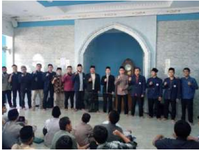
Gambar 1 Penutupan Kegiatan Tadrib Maharah Al-Lughawiyah di Masjid Pondok Pesantren Syamsul Ulum

sesuai dengan jadwal dan kesepakatan yang telah dibuat. Pelatihan dimulai pukul 08:00 sampai dengan 11:00. Sedangkan untuk tahun 2022 dilaksanakan mulai 4 April 2022 hingga 10 April 2022, dengan jumlah 6 kelas.