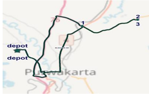
Gambar 3 Peta Rute 1 (Periode 29-09-2018)

Rute secara detail bisa dilihat dalam gambar di atas, dimana setiap rute ditandai dengan nomor kunjungan. Nomor kunjungan terkecil merupakan kunjungan yang dilayani pertama, tetapi jika costumer sama maka nomor berlaku untuk satu costumer . Untuk lebih detail bisa dilihat dalam tabel di bawah ini.