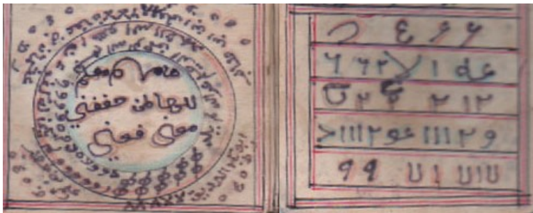
Gambar 1.1 lampiran halaman ke tujuh naskah mihir nur buat

Dalam tahap penelitian filologi seorang filolog diharuskan untuk melakukan beberapa tahapan penelitian agar naskah tersebut dapat dipahami oleh khalayak umum, satu diantara langkah penelitiannya adalah tahapan terjemah teks dan analisis kandungan isi teks. Akan tetapi faktanya, ada beberapa teks yang tak dapat dipecahkan hasil analisisnya, jika hanya diteliti secara filologis, khususnya teks yang berbentuk simbol, baik simbol yang tersusun dari satuan huruf alfabetis, maupun simbol yang tersusun dari sebuah proposisi sebagaimana yang ditemukan dalam naskah mihir nur buat, di dalamnya terdapat simbol-simbol yang tidak dapat diinterpretasikan secara filologis seperti, salah satu simbol mihir nur buat berikut ini :