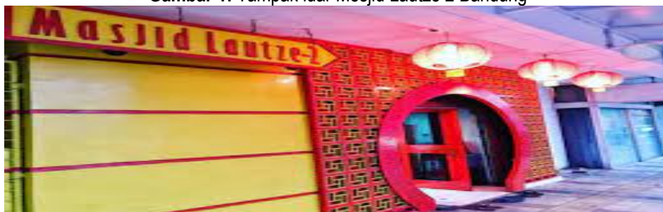
Gambar 1: Tampak luar Mesjid Lautze 2 Bandung