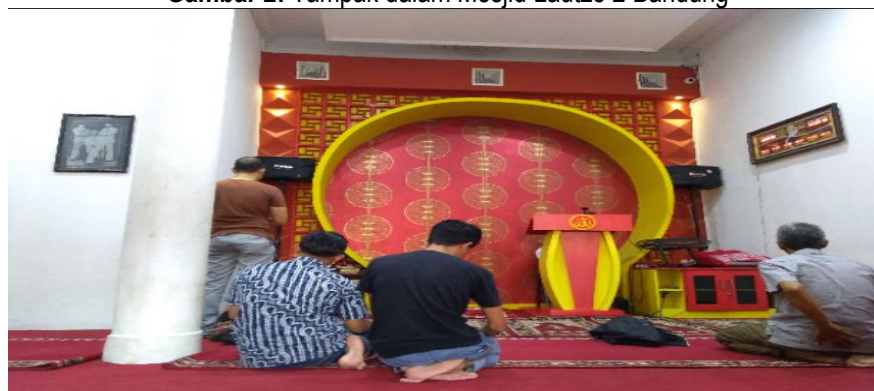
Gambar 2: Tampak dalam Mesjid Lautze 2 Bandung