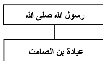
Diagram 1 Rawi dan Sanad

Berikut ini diagram sanad untuk menentukan derajat hadis: